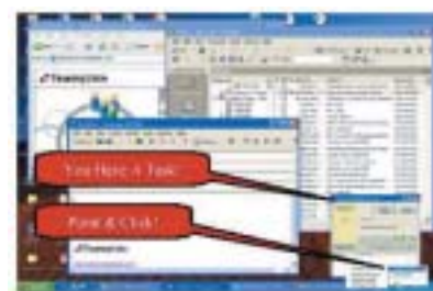
Client Workflow Services with Teamplate for .NET

Desenvolvimento Rápido de Soluções – O Teamplate proporciona um robusto Ambiente para Desenvolvimento Integrado (IDE) permitindo a criação de soluções de workflow de forma rápida e fácil. O IDE tem uma série de recursos poderosos, apresentados sob a forma de ferramentas para desenvolvimento padrão Microsoft: