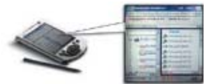
Teamplate for .NET operating on Microsoft Pocket PC

Configuração de Workflow através de Assistente - Os Usuários de Informação podem configurar o workflow em qualquer lugar, conforme permitido pelas regras de negócios, através de um Assistente passo-a-passo, assegurando a integridade da solução e criando uma interface amigável para os Usuários.